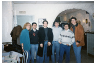
L'equip fundacional d'Amaniaco